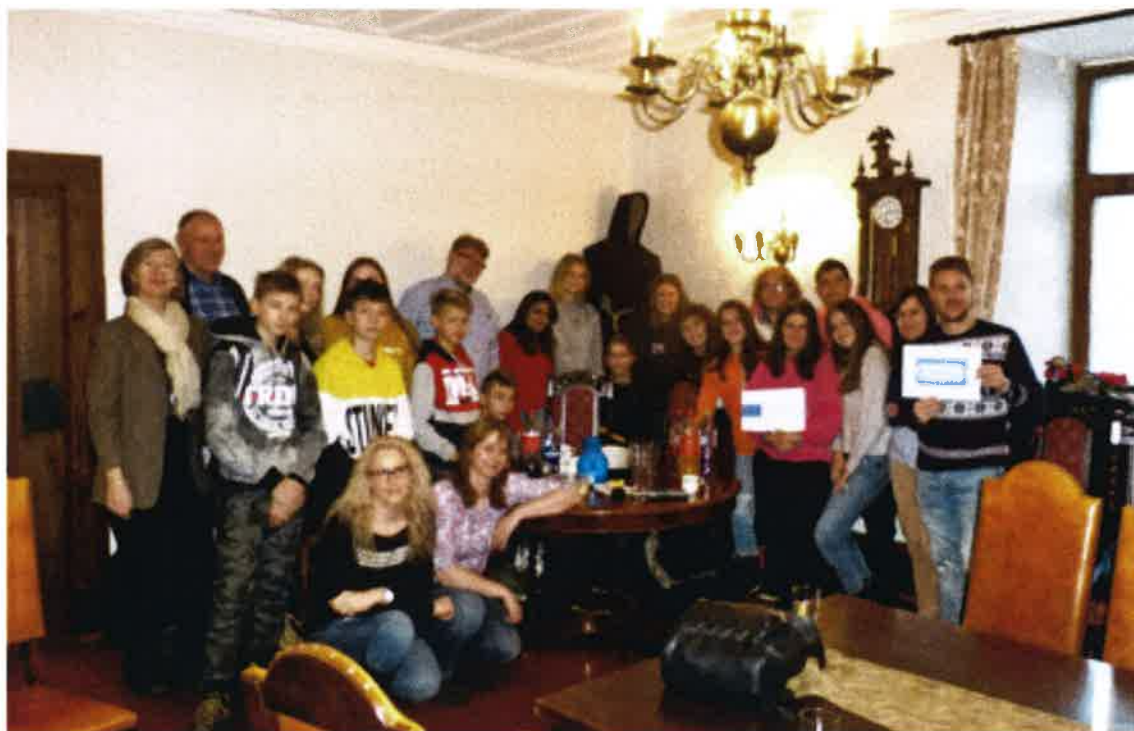
ERASMUS-prosjektet. Elever og lærere fra 4 land besøkte Støyforeningen.

skytebaneeiernes egen støydokumentasjon. Utdfordringene er ofte like for de forskjellige skytebanene. Et spørsmål er reist om skytebanenaboer kan oppnå større tyngde ved organisering og koordinering av krefter og andre ressurser.