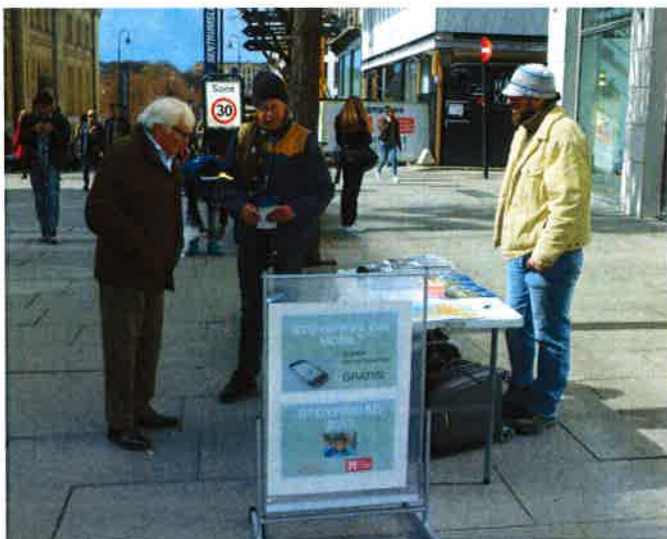
Støyfri dag: Informasjonstand om støy på Karl Johan.

Foreningen markerte dagen i samarbeid med Norsk Akustisk Selskap og markedsførte at landets rådgivende akustiske konsulenter på Støyfri dag ytet gratis støy rådgivning til landets skoler og barnehager. I Oslo hadde Støyforeningen en informasjonstand på Karl Johan i tillegg til at de ble gjort vanlige presseaktiviteter.