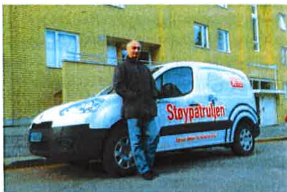
Norsk forening mot støy disponerte i 2015 en støypatruljebil. Den har vært viktig for å øke kapasiteten vår.

I løpet av 2015 har foreningen mottatt støtte i form av disponering av ressurser fra ledende bedrifter og organisasjoner som Bertel O. Steen, NSB, Fortum, Jernbaneverket, Peugeot Norge, Grønn kontakt, Fotoware og Lesanco. Det har bidratt til foreningens muligheter til å gjennomføre aktiviteter såvel som servicetilbudet overfor medlemmer.