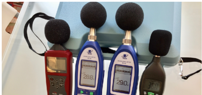
Over: Noen av støymålerne til utlån

I en del tilfeller kan medlemmenes støymålinger ledsages av skriftlige statuskommentarer fra sekretariatet. Disse statusbeskrivelsene er viktige for dem som ikke har midler til å kjøpe støydokumentasjon fra det private tilbydermarkedet, men som trenger dokumentasjon for å fremme en støysak overfor gårdeier, sameiet, utbygger, nabo, kommunal og fylkeskommunal forvaltning eller staten.