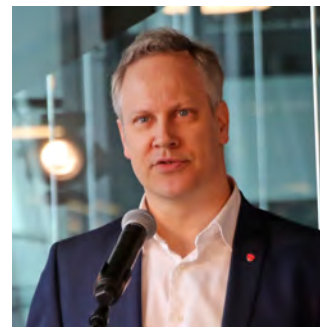
Samferdselsminister Jon-Ivar Nygård

Konferansen var tilrettelagt som et kombinert arrangement, med deltakere digitalt og i sal. Med tilsammen 130 påmeldte inklusiv foredragsholderne. For første gang hadde støyforeningen en konferansen med deltakelse fra alle landes fylker. Konferansen ble også filmet. Dessverre var det store tekniske problemer under gjennomføringen, som særlig rammet de digitale deltakerne. Etterarbeid har sikret at fullstendig program med foredrag og presentasjonsmateriell er klargjort for nettpublisering våren 2024.